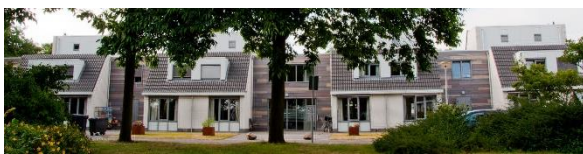
Groenendaal in woonzorgpark Het Westerhok