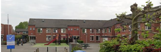
Grafelijkheidsweg in Dordrecht