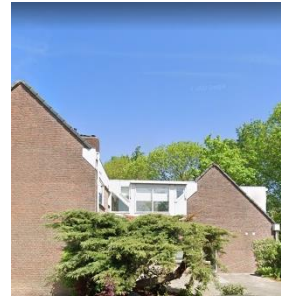
Nijenstein in Dordrecht