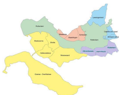
Indeling subregio's GRJR

Tijdens de werkconferentie gaf een grote meerderheid aan dat bovenlokale afspraken voor de aansluiting tussen onderwijs en jeugdhulp noodzakelijk zijn. Bij de vraag naar oplossingen om belemmering in deze aansluiting weg te nemen, wordt het meest aangegeven: gezamenlijke afspraken, duidelijke regie, investeren in samenwerking en ontschotten geldstromen. In de subgroepen tijdens de werkconferentie wordt aangegeven dat er behoefte is aan langdurige afspraken en structurele samenwerking.